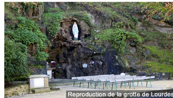
Reproduction de la grotte de Lourdes