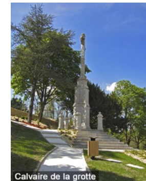
Calvaire de la grotte

• FFRandonnée Vendée : 02 51 44 27 38, vendee@ffrandonnee.fr , https://vendee.ffrandonnee.fr .