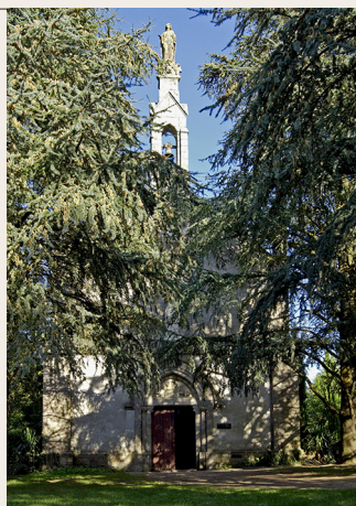
La chapelle du Petit Luc

Elle a été construite en 1866 sur les ruines de l'église Notre-Dame du Petit Luc détruite le 28 février 1794 par les armées républicaines. A l'intérieur, les 22 plaques de marbre portent les noms de 459 personnes, dont 110 enfants de moins de 7 ans, massacrés aux Lucs pendant la Révolution. Ce massacre est le plus important de tous ceux qui ont été perpétrés par les Colonnes Infernales pendant la guerre de Vendée.