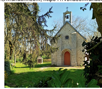
Chapelle Sainte Radegonde

Comité • FFRandonnée Vendée : 02 51 44 27 38, vendee@ffrandonnee.fr , https://vendee.ffrandonnee.fr .