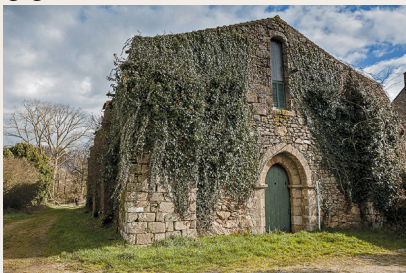
Abbaye du Lieu-Dieu

siècle dernier, on pouvait voir deux cellules dans l'enclos. L'aridité de la terre incita les moines à rechercher un autre domaine. En novembre 1198, ils gagnèrent la forêt de Jard-sur-Mer.