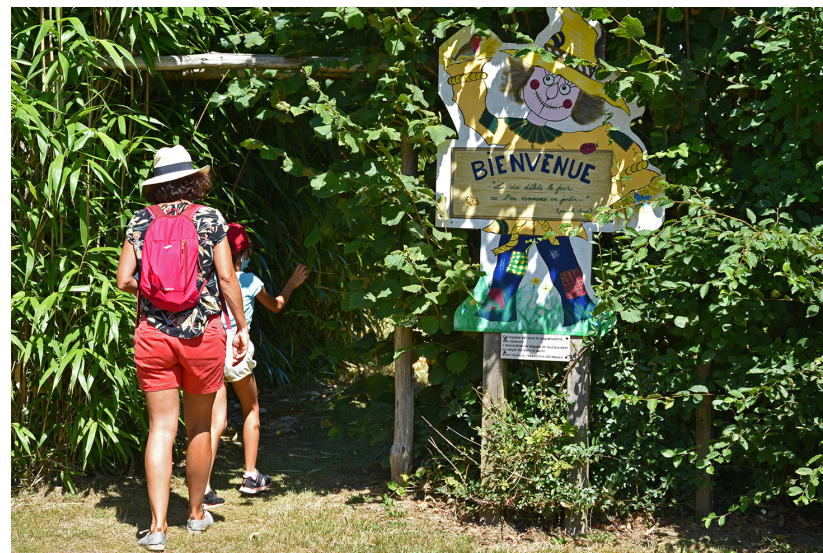
Jardin des Cinq Sens

👁 > Au carrefour, possibilité d'aller voir, à gauche à 300 m, l'abbaye du Lieu-Dieu (ne se visite pas : privé)