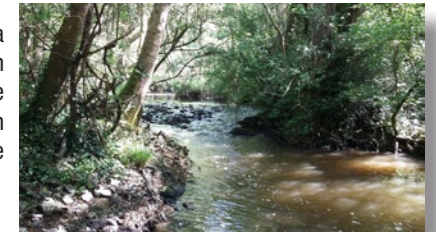
La rivière la Vie

7 Descendre par un petit sentier à gauche qui franchit la Vie. Prendre à droite avant le village de la Naulière-Bernard. Traverser à nouveau la Vie, puis atteindre Douin. Suivre la route à gauche vers La Chapelle-Palluau. Au calvaire, juste avant le bourg, rester sur la route qui part à gauche. Rejoindre par la 1 ère rue à droite le point de départ.