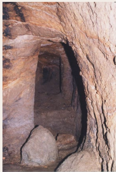
Souterrain de Piquérand

Au XI ème siècle, afin de se protéger des raids menés par les Normands, les habitants du village de Piquérand aménagèrent cette cachette creusée dans le granit. Pendant la révolution, entre 1793 et 1794, cette cache fut réutilisée afin d'échapper aux Colonnes Infernales, puis lors de la Seconde Guerre Mondiale pour abriter les réfugiés de l'Est. Les Anciens disent qu'il mène au château de Palluau, situé à 3 km et que le sous-sol de La Chapelle-Palluau est percé de nombreuses galeries. Ce souterrain se trouvant sur une parcelle privée, et pour des raisons de sécurité, il n'est plus visible du public.