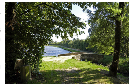
Le pont de pierre

7 Laisser la station d'épuration sur votre droite et emprunter la route qui mène au croisement. Traverser la route et remonter jusqu'au point de départ en suivant la rue du Pont Caillaud qui longe le cimetière.