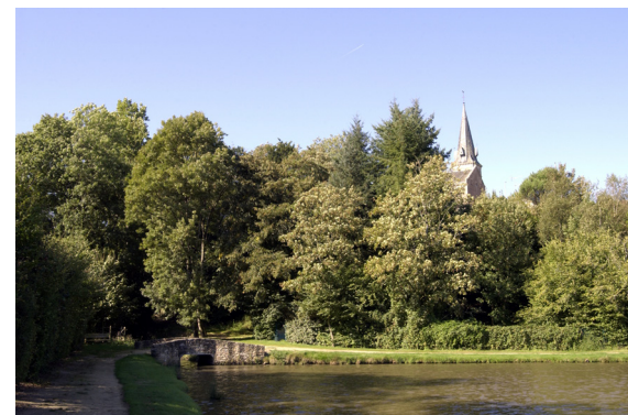
Plan d'eau des fontaines