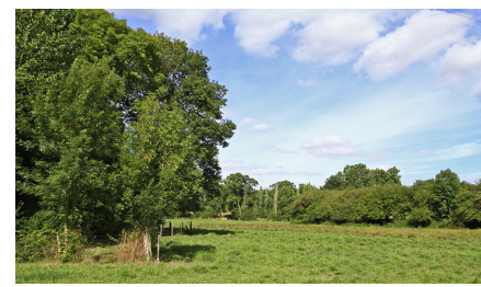
Le long de la Mongeoire

• FFRandonnée Vendée : 02 51 44 27 38, vendee@ffrandonnee.fr , https://vendee.ffrandonnee.fr .