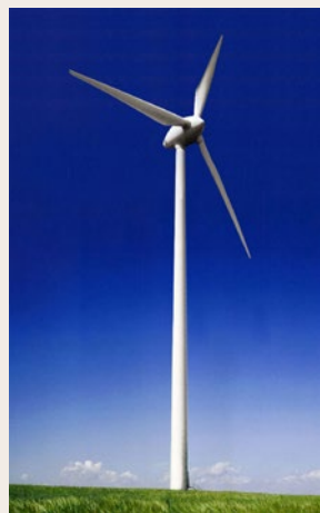
Le parc éolien

Le parc éolien de Beaufou est composé de 6 éoliennes Enercom E70 d'une puissance unitaire de 2 mégawatts. Les 12 MW produits sont introduits dans le circuit EDF au poste de Palluau. La production est l'équivalent de la consommation annuelle en énergie électrique d'environ 13 000 hab. Une éolienne a une hauteur totale de 120 m. La longueur des pales est de 35 m et la nacelle est à la hauteur de 85 m. Le poids total d'une éolienne est de 340 t. Autorisé en 2003 par le conseil municipal de Beaufou, le parc a été inauguré en mars 2008.