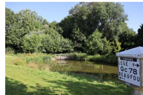
Parc de la Prée Beaufou

• Comité FFRandonnée Vendée : 02 51 44 27 38, vendee@ffrandonnee.fr , https://vendee.ffrandonnee.fr .