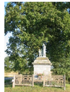
Le calvaire de la Salette