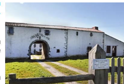
Manoir de la Tuderrière