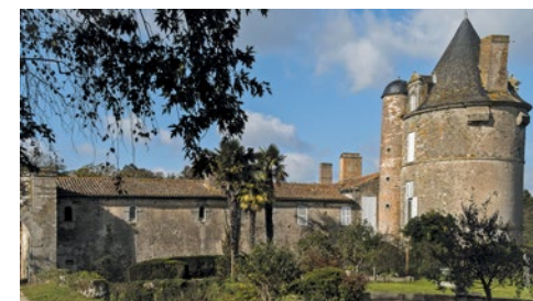
Château de l'Audardière