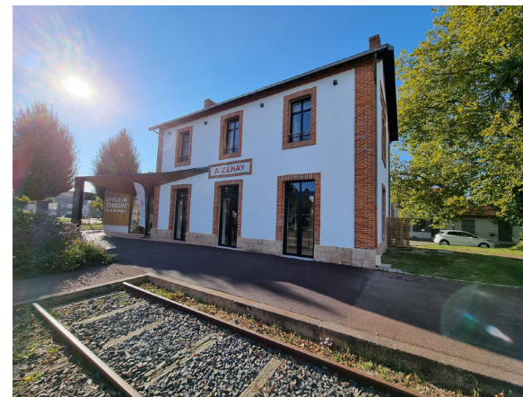
Ancienne voie ferrée et gare SNCF