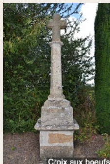
Croix aux bœufs

mois se terminaient par la bénédiction d'un monument : croix, Sacré-Cœur, calvaire, vierge. Généralement placés à une croisée de chemins, aujourd'hui on en dénombre une trentaine sur la commune.