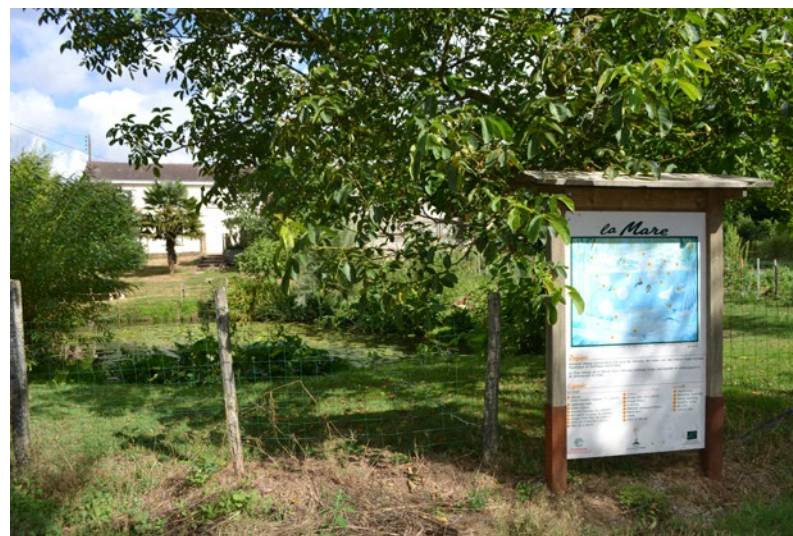
Mare de la Bessonnière

2 Bifurquer à droite sur la D755 (prudence). Après 100 m, tourner à gauche pour rejoindre le point de départ « Les Justices ».