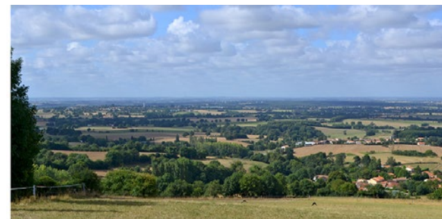
Point de vue des Justices

• FFRandonnée Vendée : 02 51 44 27 38, vendee@ffrandonnee.fr , https://vendee.ffrandonnee.fr .