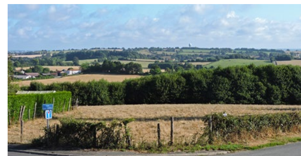
Vue sur radar des Coux

• FFRandonnée Vendée : 02 51 44 27 38, vendee@ffrandonnee.fr , https://vendee.ffrandonnee.fr .