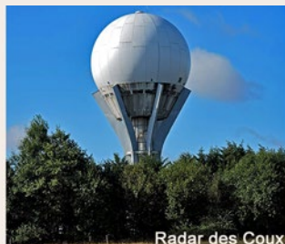
Radar des Coux

pour l'aviation. Il est la propriété du Ministère de l'Équipement. Les données enregistrées sont confrontées avec celles recueillies par les instruments de bord des avions survolant la région. C'est une mesure de sécurité créée par l'Etat à la suite de plusieurs accidents aériens.