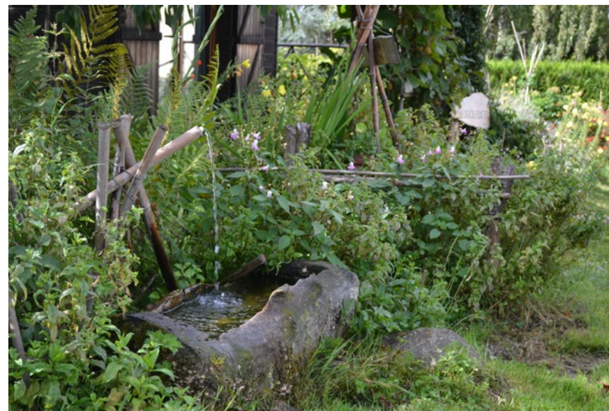
Source de la Bessonnière