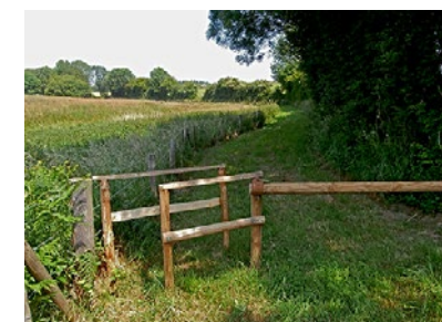
Chicane en bois de châtaignier