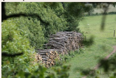
Coupe de châtaigniers

baillivias », pour servir de bois d'ouvrage. Il reste encore quelques beaux et vieux châtaigniers dans la région ; mais s'ils ne sont pas renouvelés, ils finiront par disparaître.