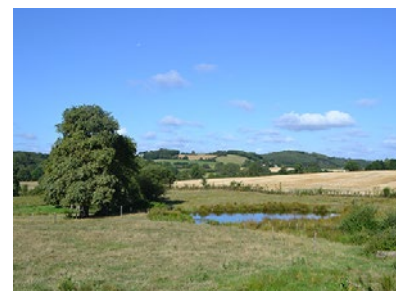
Etang de la Baire

• FFRandonnée Vendée : 02 51 44 27 38, vendee@ffrandonnee.fr , https://vendee.ffrandonnee.fr .