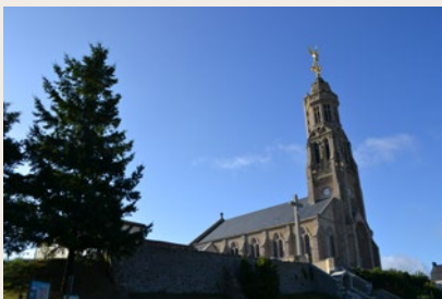
Église de Saint-Michel-Mont-Mercure

le 29 septembre 2014, elle domine la région, toute dorée à la feuille d'or. L'ascension des 197 marches de la tour ouvre sur un panorama à 360°. Dans la nef, les vitraux de forme abstraite, en dégradé de tons, invitent à la méditation.