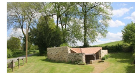
Lavoir de la Remaude

• FFRandonnée Vendée : 02 51 44 27 38, vendee@ffrandonnee.fr , https://vendee.ffrandonnee.fr .