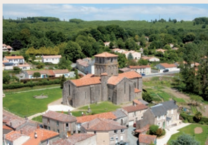
Église Notre-Dame du Vieux Pouzauges

Vierge au temple et l'annonce de l'ange Gabriel. Le second registre se compose de cartouches représentant de grotesques chimères. Le dernier registre est formé de médaillons à motifs végétaux symbolisant les mois de l'année.