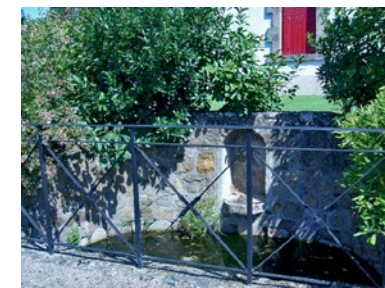
Fontaine au Vieux Pouzauges