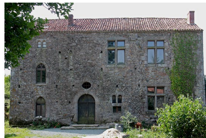
Manoir du Puy Papin (privé)