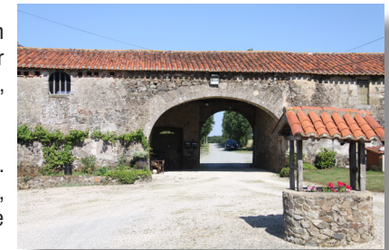
Porche du Logis de la Baudonnière (privé)