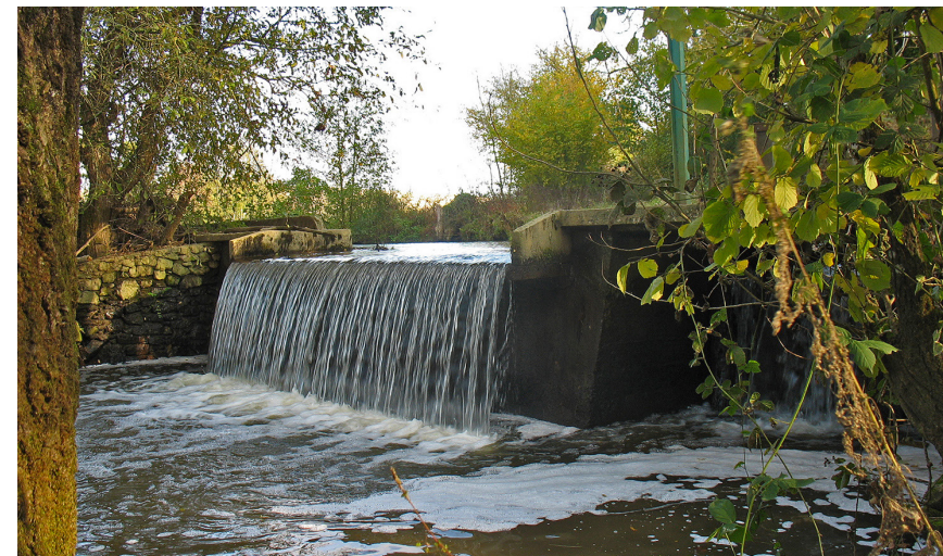
Écluse de Moque-Souris