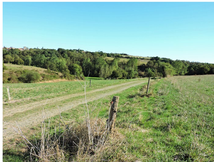
Sentier vers La Roche Batiot