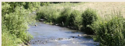
Le Grand Lay

Le Grand Lay a fait l'objet d'aménagements, notamment avec la construction de deux barrages : le barrage de l'Angle Guignard et le barrage de Rochereau.