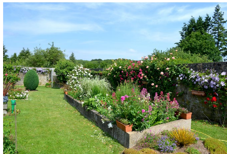
Le jardin des Carmes