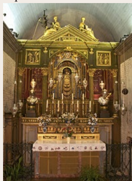
La Chapelle de Lorette

la Santa Casa au fond de la chapelle. La Sainte Maison est inscrite à l'inventaire supplémentaire des Monuments Historiques.