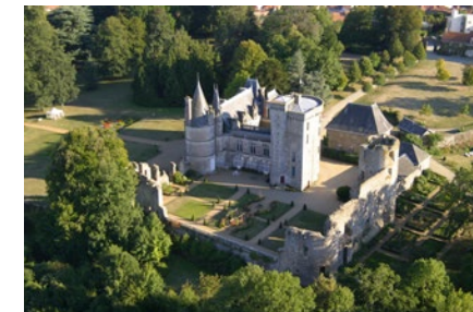
Château de la Flocellière