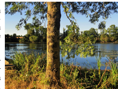
L'étang des Landes

8 Traverser la D114 et poursuivre par la route en face sur 400 m. Revenir au point de départ par la route à gauche.