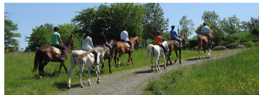
Balade à cheval

hectares de prairies sont à la disposition des cavaliers, chevaux et poneys. La ferme équestre participe régulièrement au rendez-vous national de Lamotte-Beuvron, dans le Loir-et-Cher. Elle organise elle-même de nombreux concours complets et de hunter. Le hunter est l'une des spécialités de l'équitation. Cette épreuve très technique consiste à enchaîner des obstacles avec la plus grande harmonie possible.