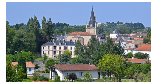
Vue depuis le Carmel